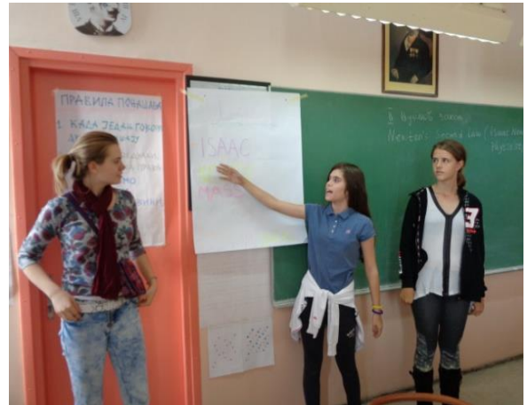
Рад ученика по групама