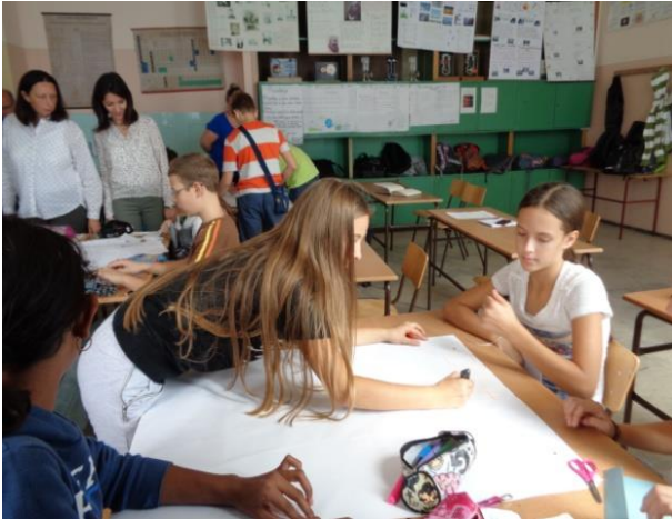
Рад ученика по групама