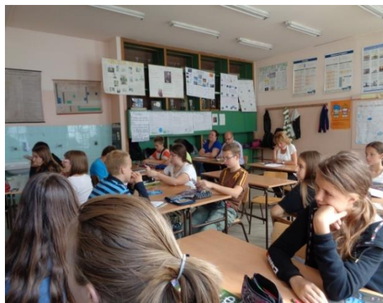
Ученици се упознају са задацима који их очекују на часу