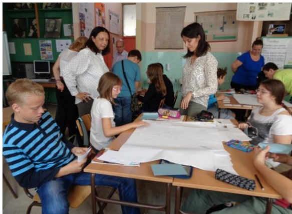
Рад ученика по групама