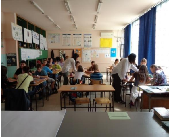
Завршни део часа