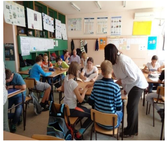
Завршни део часа