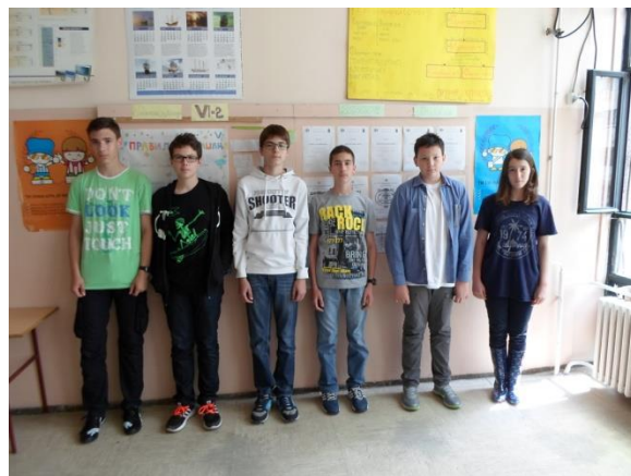
Окружно такмичење из физике, 2015.