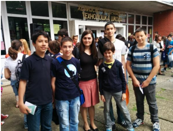
Архимедесов математички турнир, 25. 5. 2014.