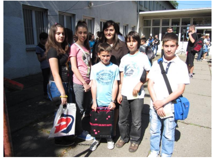
Архимедесов математички турнир, 18. 5. 2013.