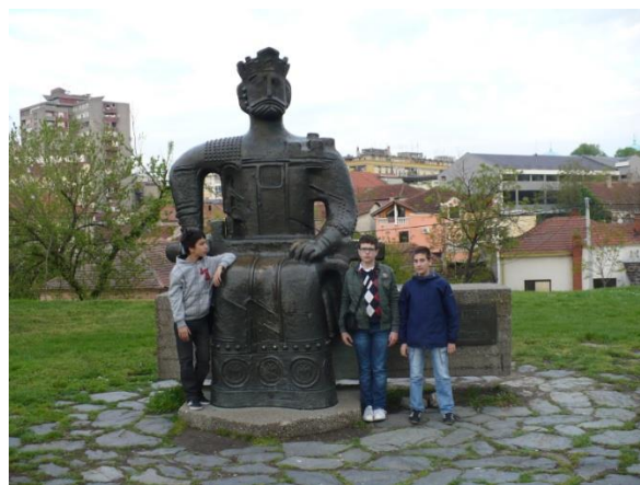
Државно такмичење из физике, 2014. у Крушевцу.