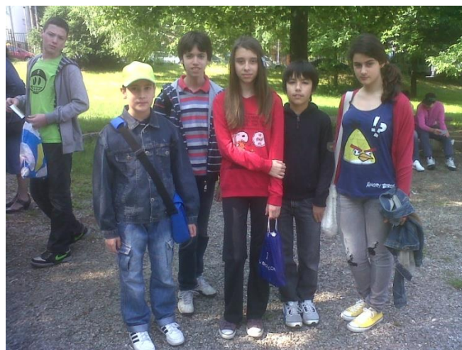
Архимедесов математички турнир, 19. 5. 2012.