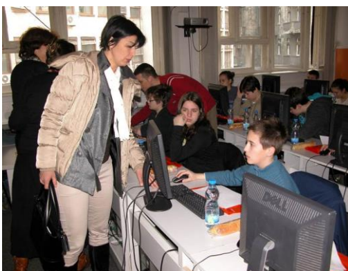
Програмирање - окружно такмичење