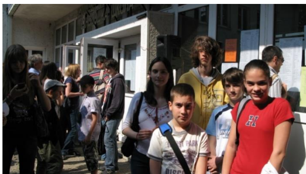
Архимедесов математички турнир 21. 5. 2011.

4. разред: 2. награда ОШ "Јован Дучић" Н. Београд - 1. награда , 120 школа