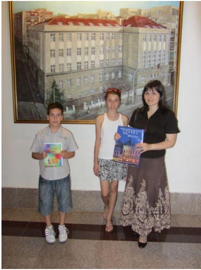
Архимедес, додела награде, 9.06.2012.